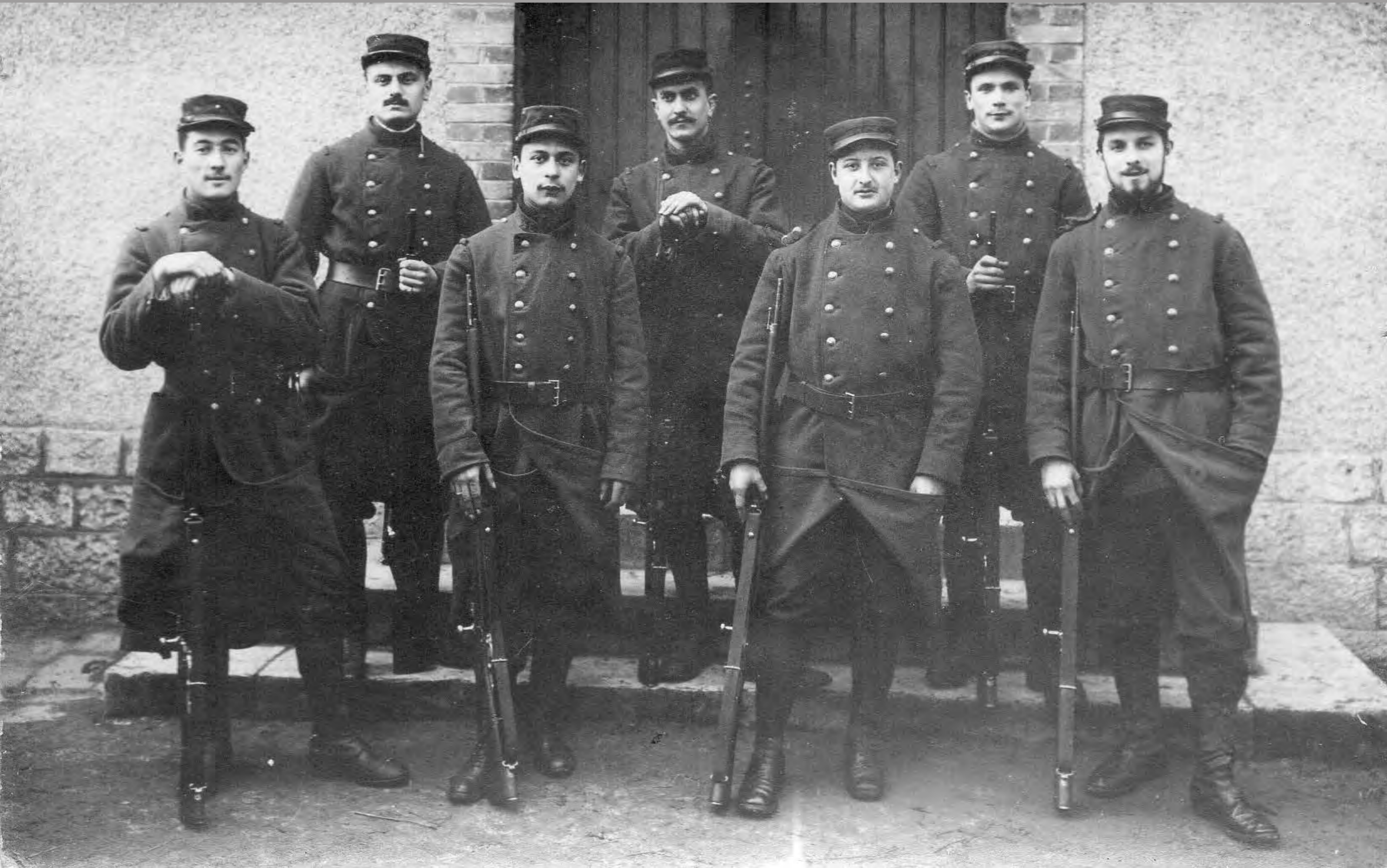
Le service militaire