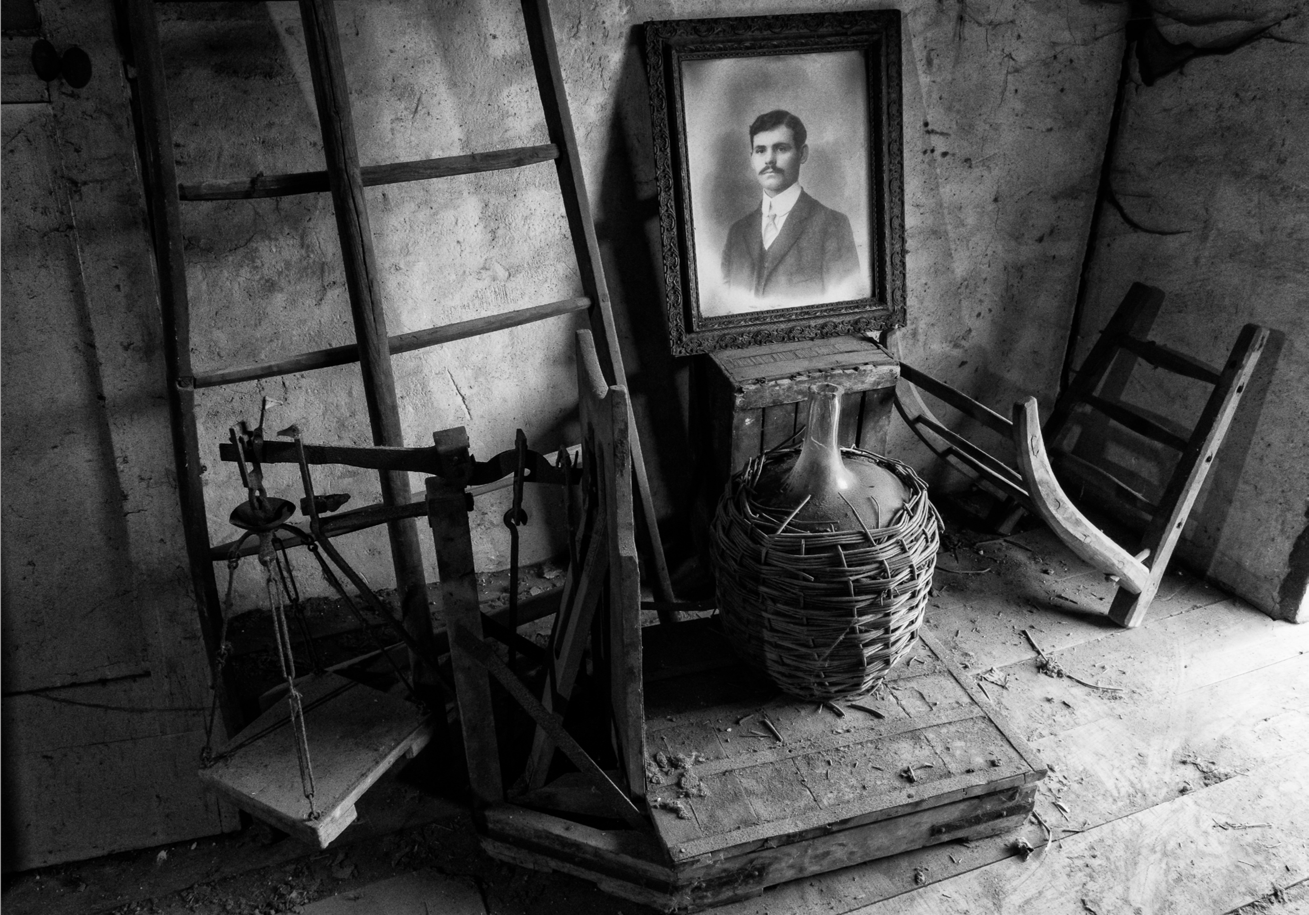
Le portrait retrouvé parmi les objets de son quotidien de cultivateur vigneron à Groslay (Seine & Oise)