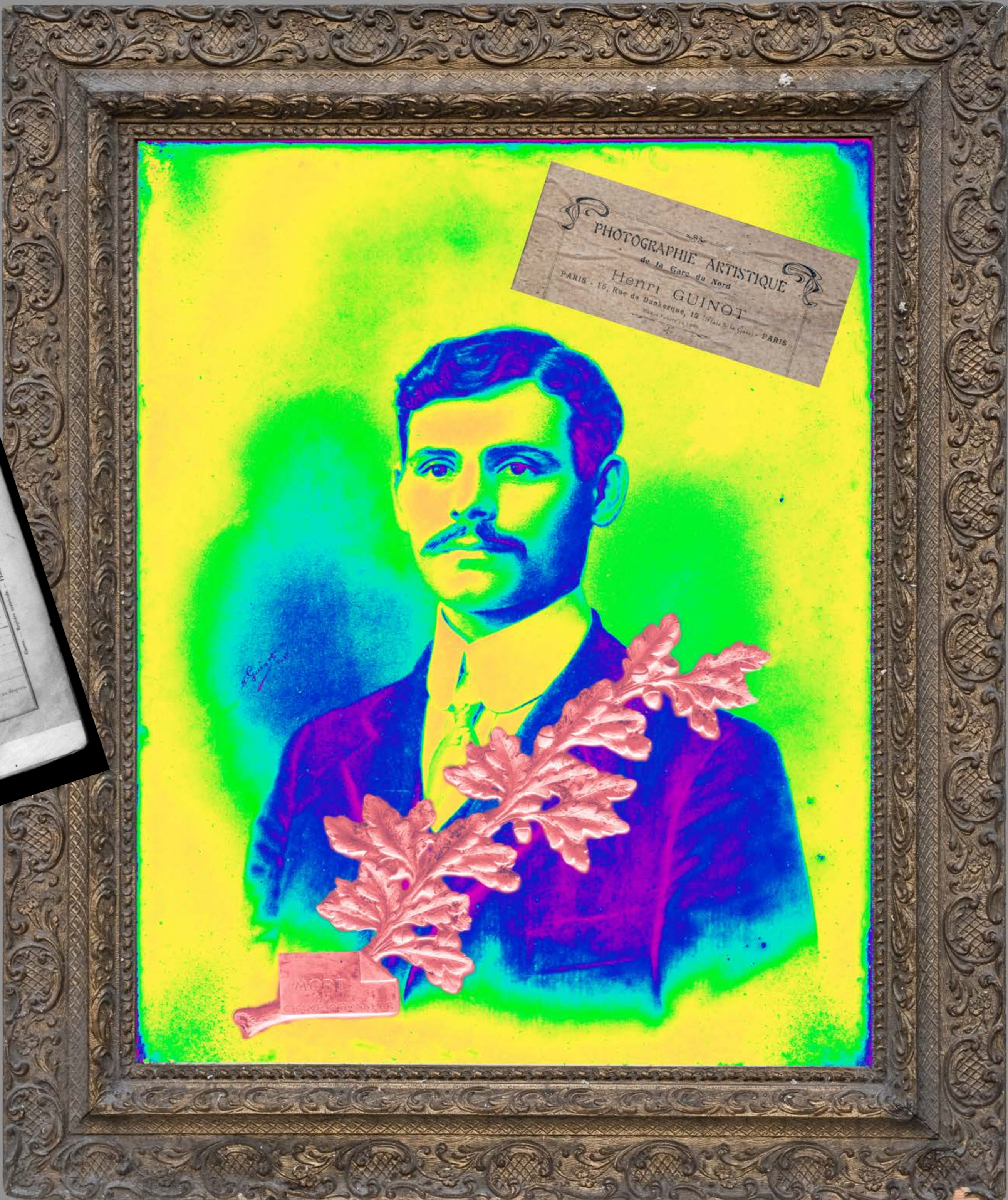
Tué à l'ennemi le 23 septembre 1914 combat de la Neuville